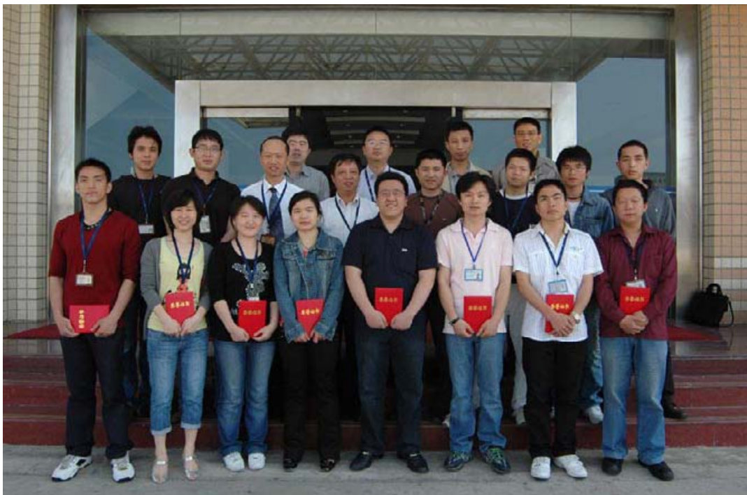
FICT2009年第一季度优秀工作者和窗口服务明星