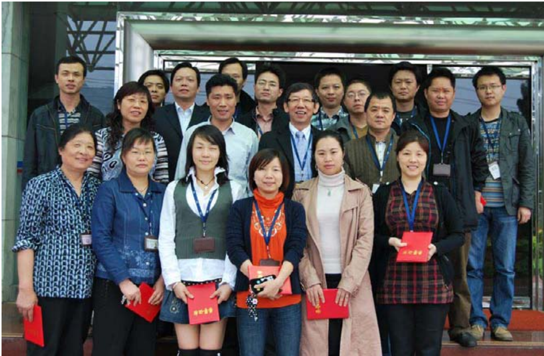
FQCT2009年第一季度优秀工作者和窗口服务明星